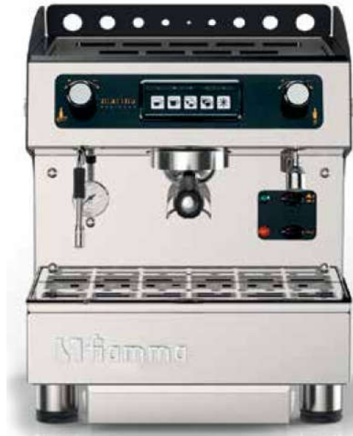
Marina CV DI

Bomba de agua rotativa Decoración y colores de los paneles exteriores