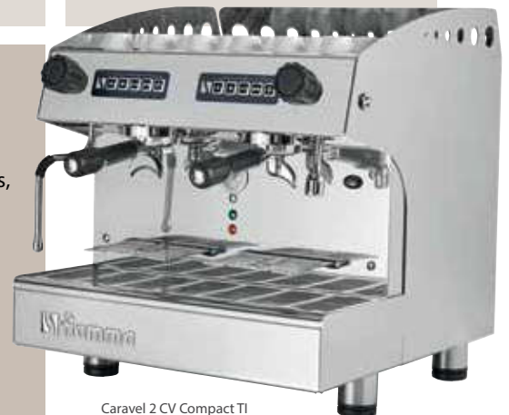
Caravel 2 CV Compact TI

Ciclos automáticos de limpieza de los grupos (modelos CV)