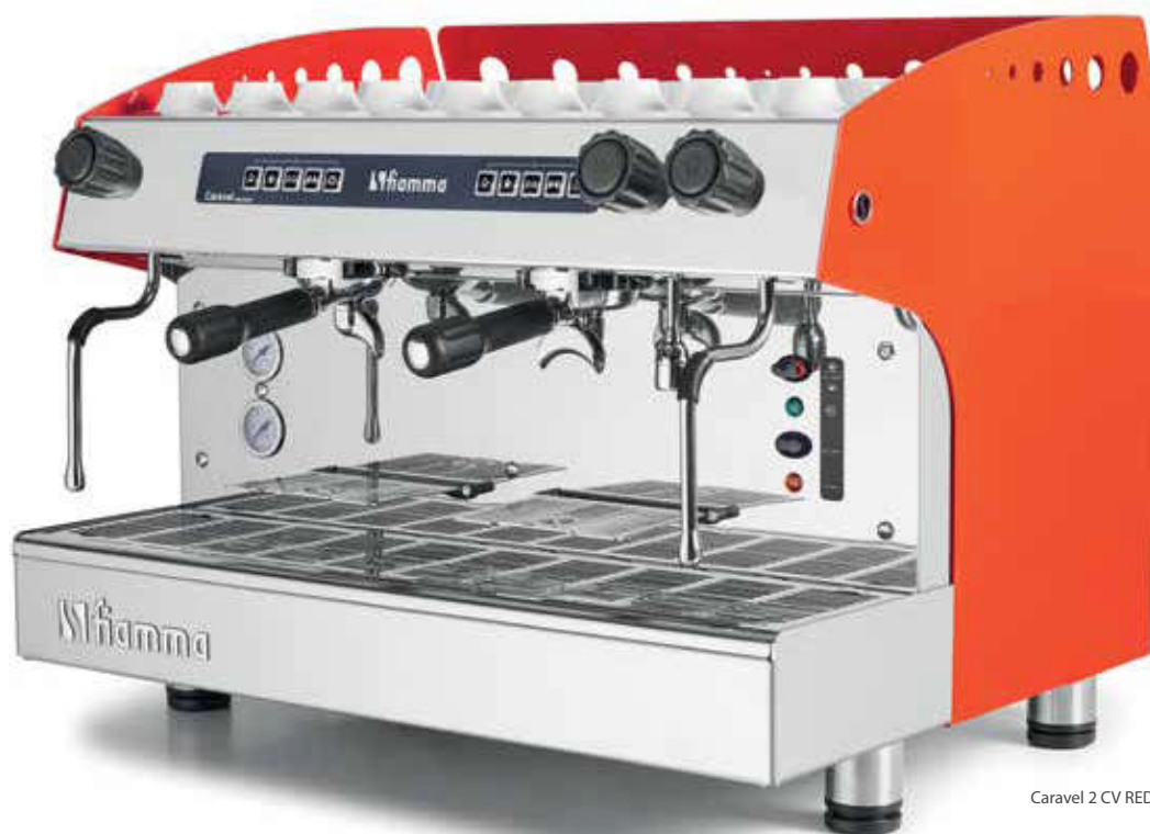
Caravel 2 CV RED